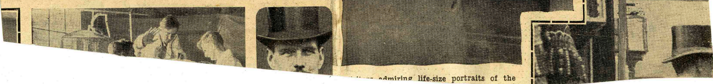
admiring life-size portraits of the